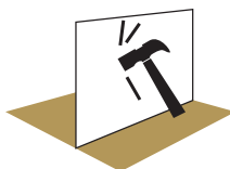
ПОВЫШЕННАЯ ВИБРО И УДАРОСТОЙКОСТЬ