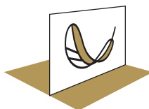
ОБЛЕГЧЕННАЯ, БЕЛОГО ЦВЕТА